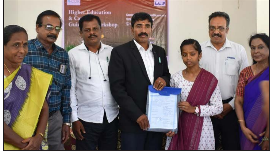
ராயக்கோட்டையில் ஆற்காட் (ஆற்காட்) தொண்டு நிறுவனம் சார்பில்