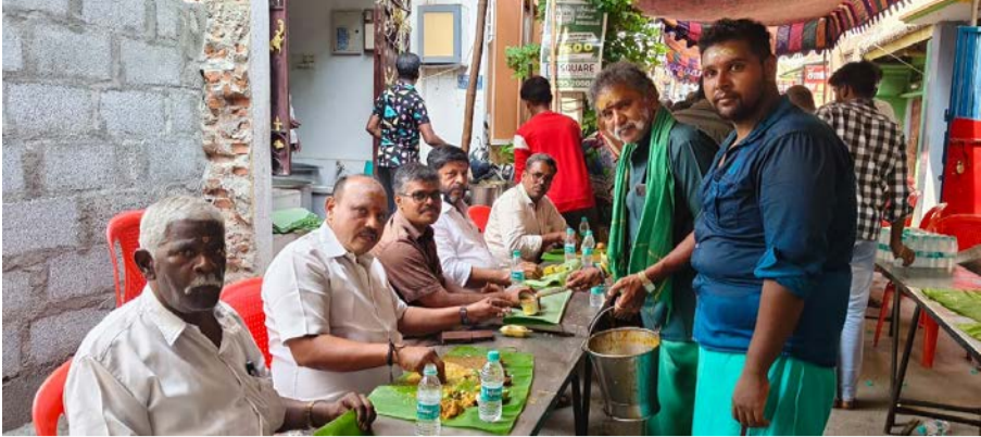
ஆழி கிஷ்ணபுரம் காளியம்மன் கோவில் வீதியில் வைகாசி மாத வளர்ச்சி சஷ்டி நாளை முன்னிட்டு