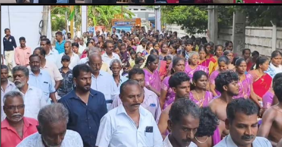
100 ஆண்டுகளைக் கண்ட சேம்பொன்வினை அரசு தொடக்கப்பள்ளி