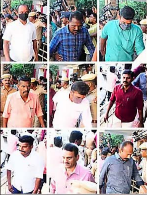
விதிக்கப்பட்டிருக்கிறது. இந்த வழக்கில் குற்றம் சாட்டப்பட்ட ஆயுள் தண்டனையை விட மரண தண்டனையை விட மரண கப்பட்டுள்ளது. இவர்களும் வேறுபாடு உள்ளது.

இருக்க வேண்டும்" என்ற நீதிபதி காவல்துறைக்கே களங்கம் ஏற்பட்டுள்ளது. இவர்களுக்கு குறைந்தபட்ச தண்டனை விதித்தால், நீதிமன்றம் என்ன செய்யும் ஆயுள் தண்டனை தானே விதிக்கும் என ஏனாமாக நினைப்பார்கள். அச்சம் என்பது உண்மையான அச்சமாக இருக்க வேண்டும். ஆயுள் தண்டனை விதிப்பது போதுமானதாக இருக்காது என இந்த நீதிமன்றம் கருதுகிறது." என்றார். அதன் அடிப்படையில் முதல் குற்றவாளி ஆய்வாளர் ஸ்ரீதருக்கு மரண தண்டனையும், ரூ.15 லட்சம் அபராதமும்