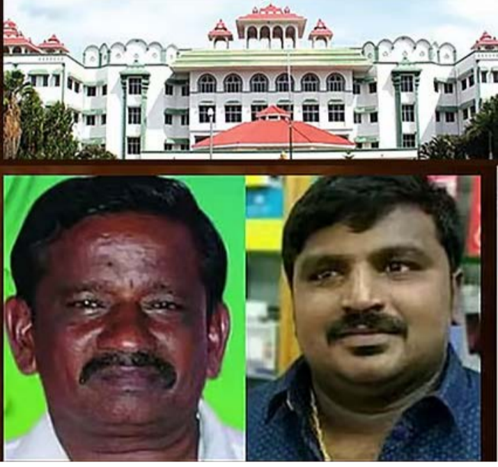
சாத்தான்குளம் சிறை மரண தண்டனையை விட மரண கப்பட்டுள்ளது. இவர்களும் வேறுபாடு உள்ளது.