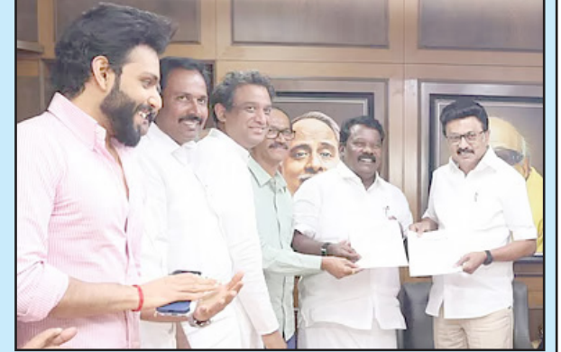
கட்சிகள் மீது திமுக செலுத்தி வருகிறது. கூடுதல் தொகுதி வேண்டும் ஆட்சி அதிகாரத்தில் பங்கு என்ற கோரிக்கையை முன்வைத்து பேசிய காங்கிரஸையும் விட்டுப் பிடிப்பது போல தற்போது திமுக காங்கிரசை கூட்டணிக்கு அழைத்து வந்துள்ளது. 2026 சட்டமன்ற தேர்தல் கடந்த தேர்தலை விட இந்த தேர்தலில் ஓரிரு தொகுதிகளை மட்டுமே அதிகப்படுத்தி கொடுத்த திமுக காங்கிரசை கூட்டணிக்குள் தக்க வைக்க முயற்சித்தது. இதை ஏற்க மறுத்து காங்கிரஸ் கூட்டணியை விட்டு வெளியேறினால் கட்சி பிளவுபடும் அபாயமில் உள்ளது. காரணம் திமுகதான் வெற்றிக்கூட்டணி என்றும், மீண்டும் திமுகவே ஆட்சியை பிடிக்கும் என்றும் நம்பும் காங்கிரசில் ஒரு தரப்பினர், திமுக கூட்டணியை காங்கிரஸ் மேலிடம் முறித்தால் கட்சியை உடைக்கவும் தயாராகி வருகின்றனர். இது வரை பலம் என்னவென்றே தெரியாத தவெகவை நம்பி பயனில்லை என்றும் திமுகவுடன் கூட்டணி நீடிக்க வேண்டும் என்றும் 13 காங்கிரஸ் எம்எல்ஏக்கள் பகிரங்கமாக போர்க்கொடி தூக்கினர். இந்த சூழ்நிலையில் காங்கிரசுக்கு 28 எம்எல்ஏ சீட்டும், ஒரு ராஜ்யசபா சீட்டும் ஒதுக்கப்பட்டு இருக்கட்சி தலைவர்களிடையே ஒப்புத்தம் எட்டப்பட்டுள்ளது.

மதுரை, மார்ச்-05-மதுரை கோ.புதூர் அல்-அமீன் மேல்நிலைப்பள்ளியில் புத்தக மதிப்புரை மதுரை, மார்ச்-05-மதுரை கோ.புதூர் அல்-அமீன் மேல்நிலைப்பள்ளியில் இலக்கியப் பூங்கா 24 புத்தகங்களை மதிப்புரை செய்தனர். சார்பாக புத்தக வாசிப்புத் திறனை ஊக்கப்படுத்தும் நோக்கில் புத்தக மதிப்புரை நடைபெற்றது. இதில் 6 ஆம் வகுப்பு முதல் 11-ஆம் வகுப்பு வரை பயிலும் 24 மாணவர்கள் இலக்கியம், அறிவியல், வணிகம் மற்றும் தலைவர்களின் வாழ்க்கை வரலாறு போன்ற 24 புத்தகங்களை மதிப்புரை செய்தனர். புத்தக மதிப்புரை செய்த மாணவர்களை இப்பள்ளியின் தலைமையாசிரியர் வேகநபி வெகுவாக பாராட்டினார். இதற்கான ஏற்பாடுகளை ஆசிரியர்கள் மற்றும் பள்ளி நிர்வாகம் சார்பில் சிறப்பாக செய்தனர்.