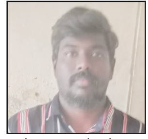
தண்டனை மற்றும் 5000 ரூபாய் அபராதம் விதித்து