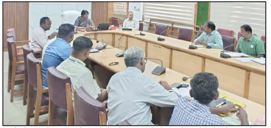
கன்னியாகுமரி மாவட்ட சுற்றுலா மேம்பாட்டு குழு கூட்டம், மாவட்ட ஆட்சியர் ஆர்.அழகர்மீனா தலைமையில் மாவட்ட ஆட்சியர் அலுவலக குறள் கூட்டரங்கில் நடைபெற்றது.

ஆனால் அதற்கான கும்பாபிஷேக திருப்பணிகள் தொடங்கப்படாததால் வருஷாபிஷேக விழா நேற்று நடைபெற்றது. அதிகாலையில் 4 மணிக்கு கோவில் நடை திறக்கப்பட்டு நிரமால்ய பூஜையும், விஸ்விஸ்வரூப தரிசனமும் நடந்தது. பின்னர் கணபதி ஹோமமும், நவகலச பூஜையும், அதைத்தொடர்ந்து காலையே 10 மணிக்கு அம்மனுக்கு எண்ணெய், பால், பன்னீர், தயிர், சந்தனகாப்பு அலங்காரத்துடன் அம்மன் பக்தர்களுக்கு அருள்பாலிக்கும் நிகழ்ச்சி நடைபெற்றது. இரவு அம்மனை வெள்ளி பல்லக்கில் எழுந்தருள் செய்து கோவிலின் உள்ள பிரகாரத்தை சுற்றி மேள தாளம் முழங்க 3 முறை வலம் வரச் செய்யும் நிகழ்ச்சியும், அதைத்தொடர்ந்து வெள்ளி சிம்மாசனத்தில் அம்மனுக்கு தாலாட்டு நிகழ்ச்சியும், அத்தாழ வைரக்கல் முக்குத்தி வைரக்கிரீட அணிவிக்கப்பட்டு