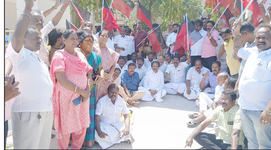
திருச்சி கோட்ட ரயில்வே மேலாளர் அலுவலகம் முன்பு முற்றுகைப் போராட்டத்தில் ஈடுபட்ட திருகவின்.