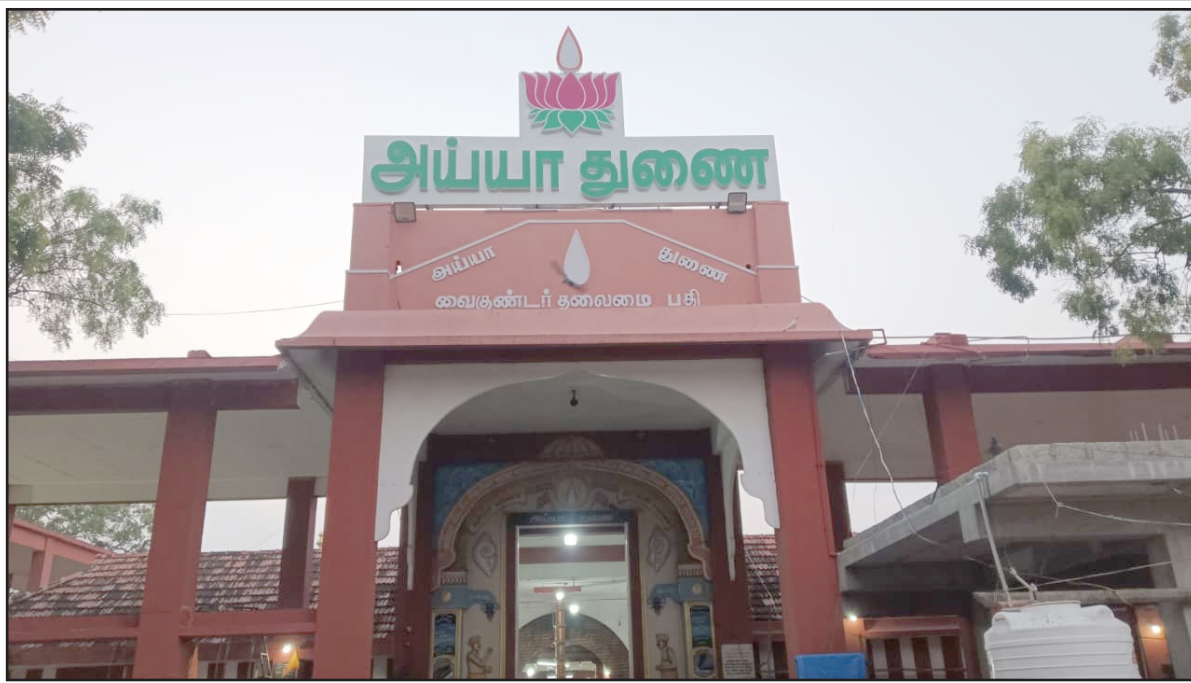
புண்ணிய பூமியாக விளங்கும் சாமிதோப்பு.

அய்யா வைகுண்டருக்கு வெற்றிலை, பாக்கு, தேங்காய், பன்னீர், பழம்,