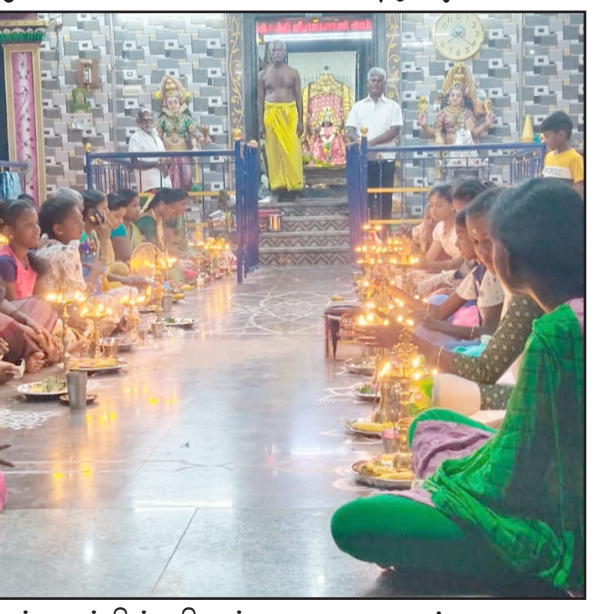
கள் சார்பில் விளக்கு பூஜை நடத்துவது வழக்கம்

திருப்புவனம், மார்ச். 03- சிவகங்கை மாவட்டம் திருப்புவனம் ஊராட்சி ஒன்றியத்திற்கு உட்பட்ட சொக்கநாதிருப்பு கிராமத்தில் அருள் பாலித்து வரும் அருள்மிகு ஸ்ரீசக்தி வீர காளியம்மன் திருக்கோயிலில் பெண்கள் சார்பில் விளக்கு பூஜை நடத்துவது வழக்கம். இந்த மாதம் பெண்கள் சார்பில் நான் விளக்கு பூஜை இரண்டாம் கரை பங்காளிகள் சார்பில் சிறப்பாக நடைபெற்றது. இந்த பூஜை யில் ஏராளமான பெண்கள் பங்கேற்று உலக நன்மை வேண்டி ஊர் மக்கள் ஒற்றுமை மற்றும் விவசாயம் செழிக்க வேண்டும் என அம்மனிடம் பிரார்த்தனை செய்து விளக்கு ஏற்றி சிறப்பு வழிபாடு செய்தனர். இதற்கான ஏற்பாடுகளை முனியாண்டி தேவர் வகையறாவினர் சிறப்பாக செய்திருந்தனர்.