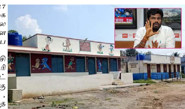
கொள்ளாமல் இருப்பது, அரசின் முழு மையான தோல்வி. உடனடியாக இந்த பிரிவினை முறையை நிறுத்தி, அனைத்துக் குழந்தைகளுக்கும் சம உரிமையுடன் ஒரே அங்கன்வாடியில் கல்வி மற்றும் ஊட்டச்சத்து வழங்க தமிழக அரசு நடவடிக்கை எடுக்க வேண்டும். இவ்வாறு அதில் தெரிவிக்கப்பட்டுள்ளது

அண்ணாமலை கண்டனம் சென்னை, மார்ச். 27 தமிழக முன்னாள் பாஜக தலைவர் அண்ணாமலை வெளியிட்டுள்ள எக்ஸ் தள பதிவில் தெரிவித்துருப்பதாவது: நாமக்கல் மாவட்டம், ராசிபுரம் ஒன்றியம், காக்காவேரி ஊராட்சி புதுகாலனியில் பட்டியல் சமூக குழந்தைகளுக்கு தனி யாக வும், பிற்படுத்தப்பட்ட குழந்தைகளுக்கு தனியாகவும் பல அண்டுகளாக இரண்டு அங்கன்வாடி மையங்கள் செயல்படுவது கடுமையாக கண்டிக்கத்தக்கது. 21 ஆம் நூற்றாண்டில் கூட, இப்படி ஜாதிப்பாகுபாடு நடைபெறுவது வெட்கக்கேடு. ஏதுமறியா குழந்தைகளிடம், பிரிவினையை விதைக்கும் இந்த செயல், அரசியலமைப்பின் சமத்துவக் கொள்கைக்கு அவமானச் சின்னம். இத்தனை ஆண்டுகளாக இதனைக் கண்டு