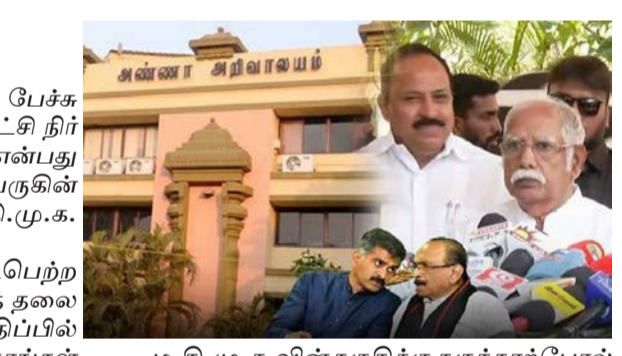
ம.தி.மு.க.வின் தகுதிக்கு தகுந்தாற்போல் எங்களுக்கு தொகுதி ஒதுக்கி செய்யப்படவில்லை. ம.தி.மு.க.விற்கு ஒதுக்கப்பட்டுள்ள நாளுக்கு தொகுதிகள் குறித்து இன்று மாலைக்குள் தெரிந்துவிடும் என்றார். இதனிடையே, மதுரை தெற்கு, மொடக்குறிச்சி, கோவில்பட்டி, சீர்காழி (தனி) ஆகிய தொகுதிகள் ம.தி.மு.க.வுக்கு ஒதுக்கப்படும் என தகவல் வெளியாகி உள்ளது.