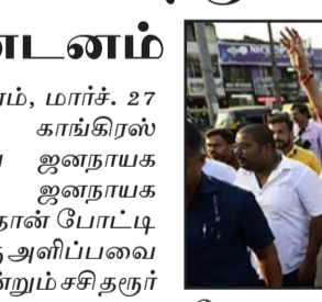
மோடியை இந்தியாவுக்கு நாடு கடத்த இங்கிலாந்து நீதிமன்றம் ஏற்கனவே உத்தரவிட்ட நிலையில், அதை எதிர்த்து அவர் தொடர்ந்த மேல்முறையீட்டு மனுவை விசாரித்த அந்நாட்டு உயர் நீதிமன்றம் மனுவை தள்ளிய செய்துள்ளது. இது குறித்த செய்தியாளர்களின் கேள்விக்கு பதில் அளித்த சசி தரூர், “இது மிகவும் வரவேற்கத்தக்க ஒரு விஷயம். சட்ட நடவடிக்கைகளில் இருந்து தப்பி ஓடியவர்கள் வெளிநாடுகளில் தஞ்சம் புக அனுமதிக்கக்கூடாது. அவர்கள் நிரபராதிகள் என்றால், தராளமாக இந்தியாவுக்கு வரட்டும்; இங்குள்ள நீதிமன்றத்தின் முன்பும்; நீதிபதியின் முன்பும் நின்று நிராதிபதி என்பதை நிரூபிக்கட்டும். அதுவே மிகவும் நியாயமான அணுகுமுறை. ஆனால், நம்நாட்டை விட்டு வெளியேறி வேறு நாடுகளில் தஞ்சம் புகுந்த குற்றவாளிகள் பலர் உள்ளனர். அமெரிக்கா, இங்கிலாந்து ஆகிய நாடுகளின் நீதி அமைப்புகள் அத்தகைய குற்றவாளிகளை மீண்டும் இந்தியாவுக்கே திருப்பி அனுப்பினால், அது நமக்கு மிகவும் நன்மை பயப்பதாக இருக்கும்” என தெரிவித்துள்ளார்.

சசி தரூர் கண்டனம் திருவனந்தபுரம், மார்ச். 27 கேரளாவில் காங்கிரஸ் தலைமையிலான ஐக்கிய ஜனநாயக முன்னணிக்கும் இடது ஜனநாயக முன்னணிக்கும் இடையேதான் போட்டி என்றும், இங்கு பாஜகவுக்கு அளிப்பவை வீணான வாக்குகள் தான் என்றும் சசி தரூர் தெரிவித்துள்ளார். கேரள சட்டப்பேரவைத் தேர்தல் ஏப்ரல் 9ம் தேதி நடைபெற உள்ளது. இதை முன்னிட்டு மாநிலத்தில் தீவிர பிரச்சாரம் மேற்கொள்ளப்பட்டு வருகிறது. இந்நிலையில், கேரள தேர்தல் தொடர்பாக செய்தியாளர்களிடம் பேசிய சசி தரூர், “எனது முழு கவனமும் கேரள மாநில தேர்தல் மீது தான் உள்ளது. அசாம், மேற்கு வங்கம், தமிழ்நாடு ஆகிய மாநிலங்களில் உள்ள எனது சகாக்கள் அனைவரும் தீவிர தேர்தல் பிரச்சாரத்தில் ஈடுபட்டுள்ளனர். கேரளாவைப் பொறுத்தவரை மக்கள் ஒரு மாற்றத்தை எதிர்பார்க்கிறார்கள். இம்மாநிலத்தில் பாஜக என்பது முற்றிலும் புறக்கணிக்கத்தக்க சக்தி அல்ல என்றாலும், உண்மையான போட்டி என்பது ஐக்கிய ஜனநாயக முன்னணிக்கும் இடது ஜனநாயக முன்னணிக்கும் இடையேதான் உள்ளது. எனவே, பாஜகவுக்கு அளிக்கும் வாக்குகள் என்பது வீணான வாக்குகள் தான்” என தெரிவித்துள்ளார். பஞ்சாப்தேஷன்ஸ் வங்கியில் ரூ.13,800 கோடிக்கும் அதிகமாக மோசடி செய்த வழக்கில் குற்றம் சாட்டப்பட்டுள்ள நீர்வ