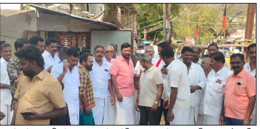
பாட்டம் நடைபெற்றது. ஆர்ப்பாட்டத்தில் சமையல் எரிவாயு விலை உயர்வு மற்றும் தட்டுப்பாட்டை கண்டித்தும், தமிழ்நாட்டை தொடர்ந்து வஞ்சித்து வரும் மத்திய அரசு மற்றும் அதன் கூட்டணியை கண்டித்தும் பல்வேறு கண்டன கோஷங்கள் எழுப்பப்பட்டன. ஆர்ப்பாட்டத்திற்கு தேவதானப்பட்டி நகர்

தேவதானப்பட்டி, மார்ச் 16 தேனி மாவட்டம் தேவதானப்பட்டியில் மத்திய அரசை கண்டித்து மதச்சார்பற்ற முற்போக்கு கூட்டணி சார்பில் மாபெரும் கண்டன ஆர்ப்பாட்டம் நடைபெற்றது. தேனி வடக்கு மாவட்ட கழக செயலாளர் மற்றும் தேனி பாராளுமன்ற உறுப்பினர் தங்கதமிழ்ச்செல்வன், சட்டமன்ற உறுப்பினரும் தெற்கு ஒன்றிய கழக செயலாளருமான சரவணகுமார் ஆகியோரின் அறிவுறுத்தலின்படி தேவதானப்பட்டி பேரூர் கழகத்தின் சார்பில் வைகை அணை சாலை சந்திப்பில் ஆர்ப்பாட்டம் நடைபெற்றது.