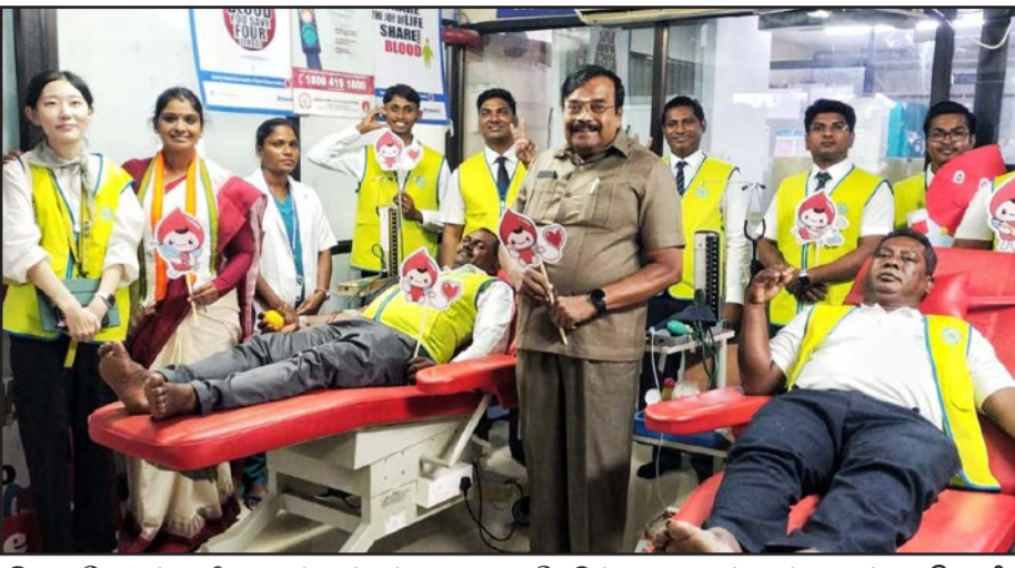
உள்ளே நேசிப்பது போல உன் அண்டவீட்டாரையும் நேசி என்ற இயேசு கிறிஸ்துவின் போதனையை நடைமுறைப்படுத்த உறுப்பினர்கள் ஒன்றிணைந்துள்ளனர். உள்நாட்டிலும் வெளிநாட்டிலும் இரத்தானம் இயக்கம், தாய்மை பணி இயக்கம், பேரிடர் நிவாரணம், உட்பட 45,000க்கும் மேற்பட்ட சமூகப் பங்களிப்பு நடவடிக்கைகளை உலக