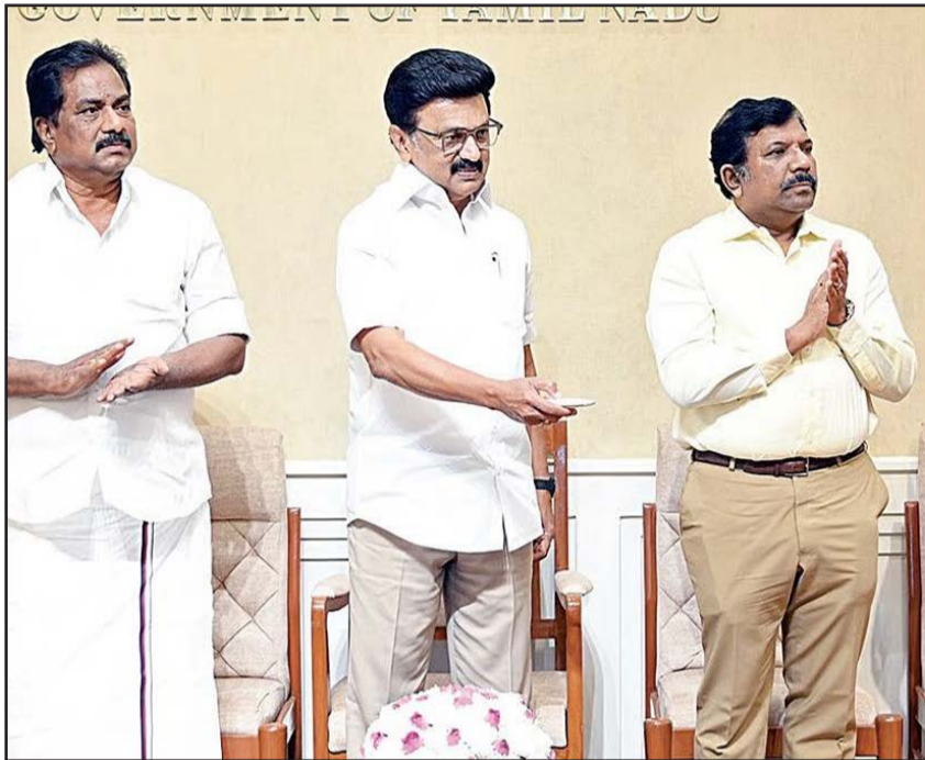
சென்னை, மார்ச் 12. ஊராட்சித் துறை, நகர்ப்புற வாரியம் ஆகியவை சார்புத்துறை, ஊரகவாழ்விட மேம்பாட்டு பில் ரூ.155.81 கோடி