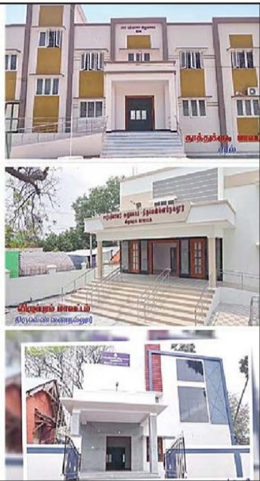
யில் சார்புத்துறை அலுவலகங்கள், அடுக்குமாடி