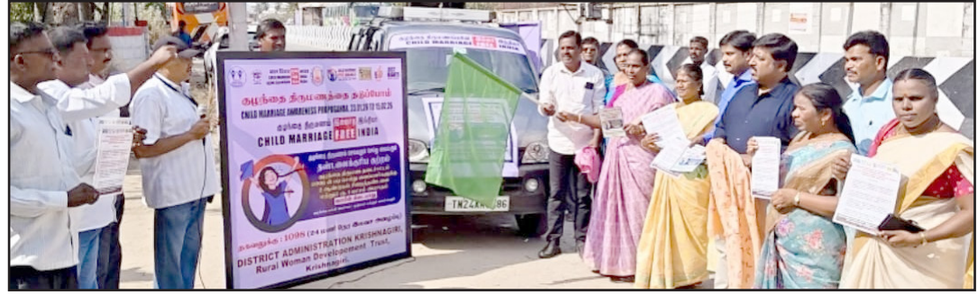
கிருஷ்ணகிரியில் குழந்தை திருமணம் தடுப்பு தொடர்பான விழிப்புணர்வு பிரச்சாரம் நடைபெற்றது, இதில் குழந்தை திருமணத்தை தவிர்க்கப்பட வேண்டும் என்பதுதான் வலியுறுத்தி துண்டு பிரசாரம் வழங்கப்பட்டது