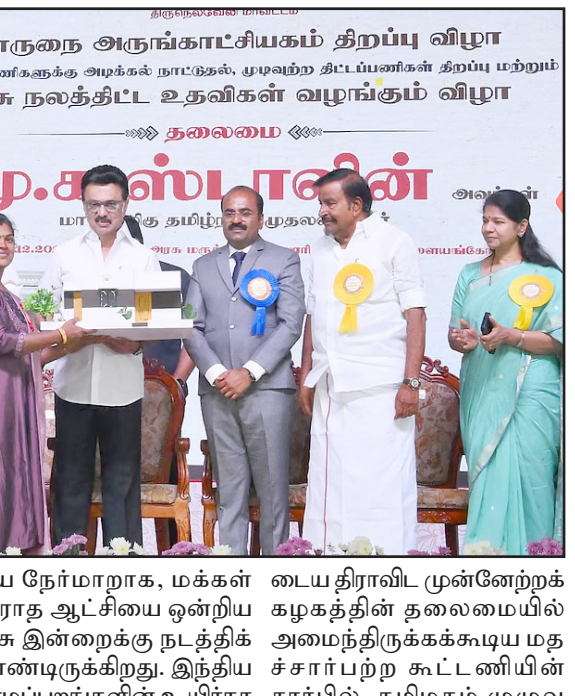
யொருநை அருங்காட்சியகம் திறப்பு விழா புகழ் தட்டிக்கொடுக்க அடிக்கல் நாட்டுதல், முடிவுற்ற திட்டப்பணிகள் திறப்பு மற்றும் அரசு நலத்திட்ட உதவிகள் வழங்கும் விழா

பிறகு தமிழ்நாடு தொல்லியல் துறை சார்பில், சிவகலை உள்ளிட்ட அகழாய்வுகளை மேற்கொண்டு இப்போது உலகமே திரும்பிப் பார்க்கக்கூடிய அளவிற்கு பொருளை அருங்காட்சியகத்தை உருவாக்கி இருக்கிறோம். அதனால், இந்த நேரத்தில் பிரதமர் மோடி வரையும், நிதியமைச்சர் நிர்மலா சீதாராமனையும் தமிழ்நாட்டில் கட்டியிருக்கக்கூடிய கீழடி அருங்காட்சியகத்திற்கு வந்து பார்க்கவேண்டும் என்று இந்த கூட்டத்தின் மூலமாக, நான் அன்போடு அவர்களை அழைக்கிறேன். நீங்கள் வந்து பாத்தால்தான் தமிழினுடைய நாகரீகம் எந்த அளவுக்கு தொன்மை கொண்டிருக்கிறது என்பது தெரியும்.